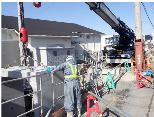
ボックスカバート布設状況