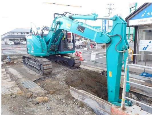
オープンシールド機による掘進(土留・掘削)状況

2月は、オープンシールド機により掘進(土留・掘削)しながら、ボックスカバート布設及び埋戻しを行いました。 3月は、引き続き、ボックスカバート布設等を行い、2工区の工事が完了する見込みです。