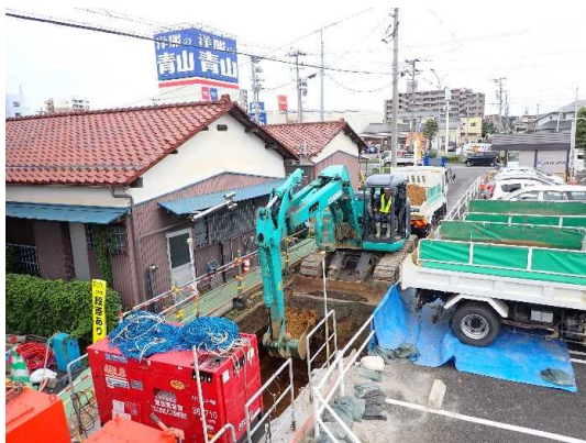
オーブソーラー機による掘進(土留・掘削)状況

7月は、オーブソーラー機により掘進(土留・掘削)しながら、ボックスカバート布設及び埋戻しを行いました。 8月は、引き続き、オーブソーラー機により掘進しながら、ボックスカバート布設等を行います。