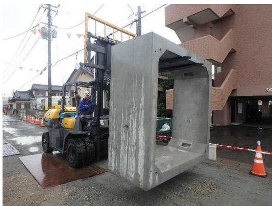
ボックスカバート搬入・運搬状況