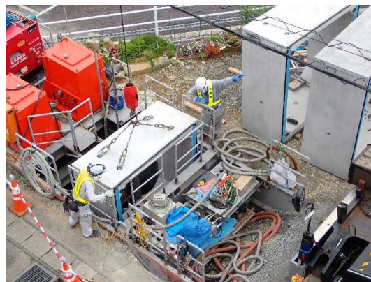
ボックスカバート布設状況