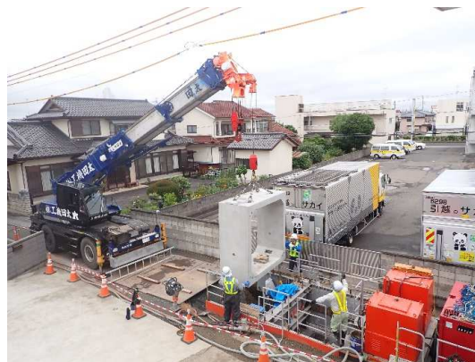
ボックスカバート布設状況