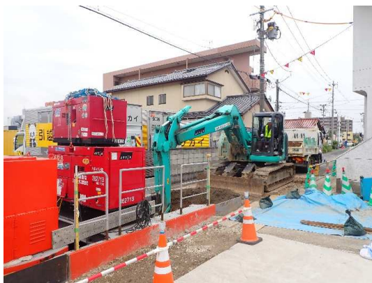
オープンシールド機による掘進(土留・掘削)状況

6月は、オープンシールド機により掘進(土留・掘削)しながら、ボックスカバート布設及び埋戻しを行いました。 7月は、引き続き、オープンシールド機により掘進しながら、ボックスカバート布設等を行います。