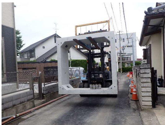
ボックスカバート搬入・運搬状況