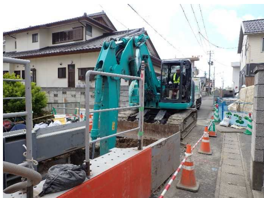
オーブソールド機による掘進(土留・掘削)状況

4月は、オーブソールド機により掘進(土留・掘削)しながら、ボックスカバート布設及び埋戻しを行いました。 5月は、引き続き、オーブソールド機により掘進しながら、ボックスカバート布設等を行います。