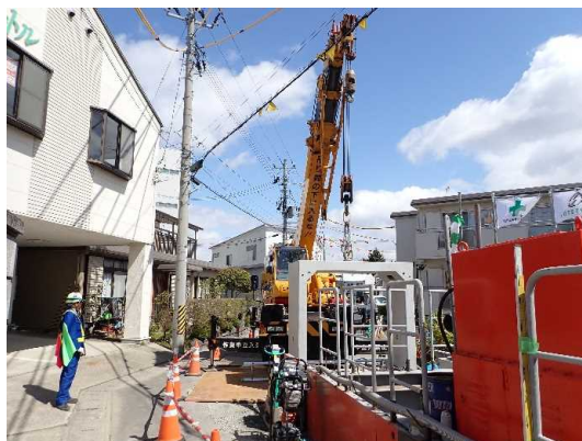
ボックスカバート布設状況