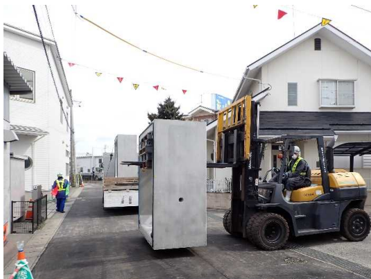
ボックスカバート搬入・運搬状況