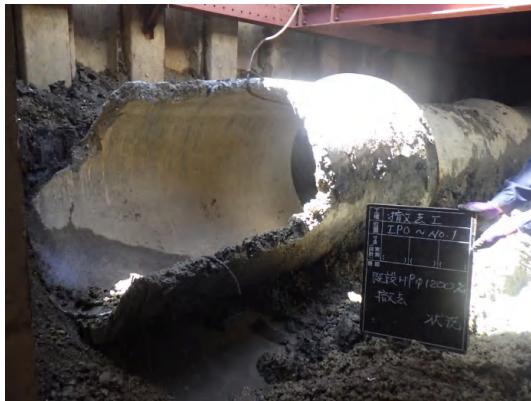
既設雨水管撤去状況