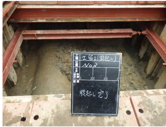
掘削(支保工設置)状況