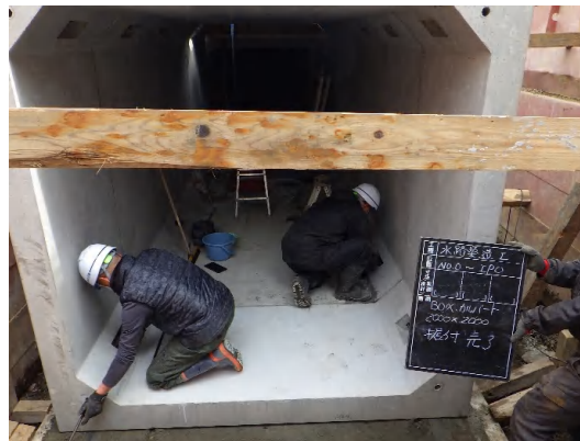
ボックスカルバート布設状況