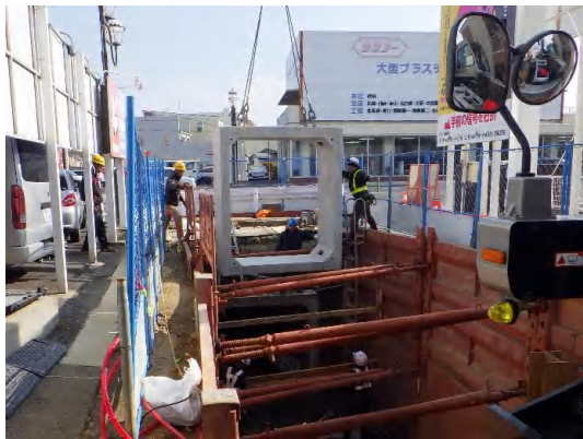
ボックスカルバート布設状況