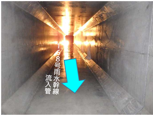
ボックスカルバート(内部)状況(最下流側から上流側)