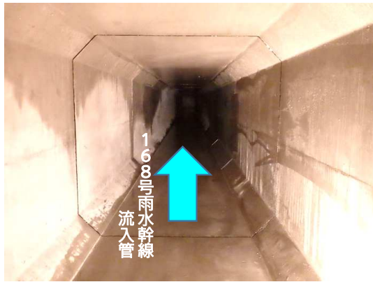
ボックスカルバート(内部)状況(中間付近から下流側)