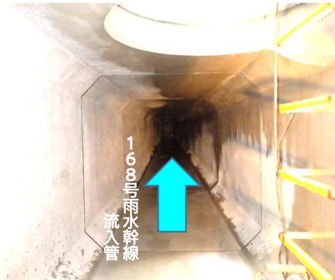
ボックスカルバート(内部)状況(最上流から下流側)