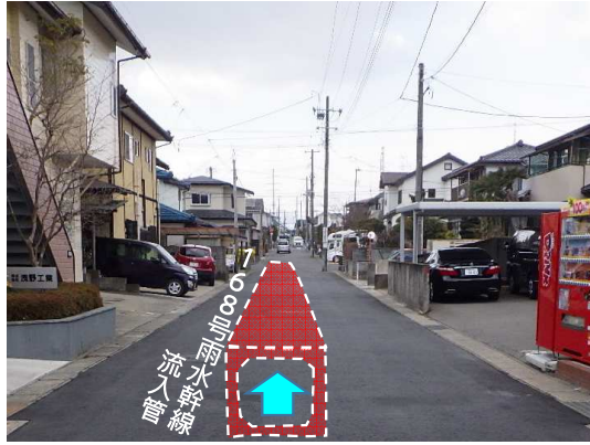
舗装復旧完了状況(上流側から下流側へ)