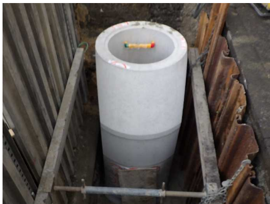
マンホール設置状況