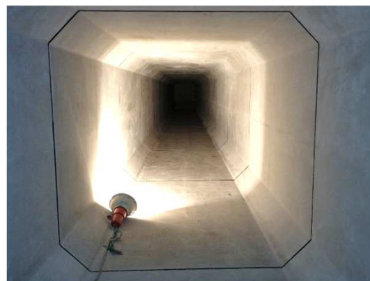
ボックスカルバート(内部)状況(R2.11月末時点)