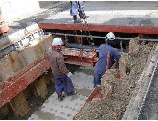
仮設土留(支保工)撤去状況

12月は、仮設土留(支保工・鋼矢板)及び覆工板撤去、マンホール設置等を行いました。 1月は、污水管移設及び舗装仮復旧を行います。