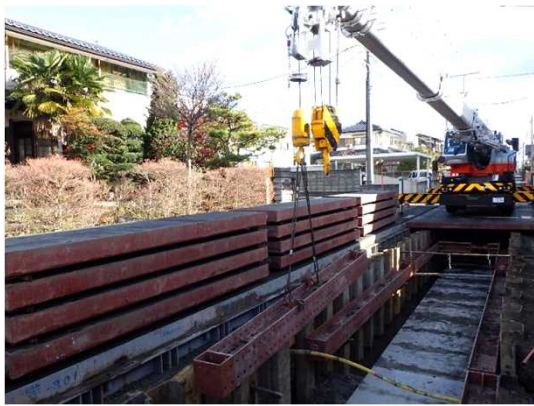
仮設土留(支保工)撤去状況