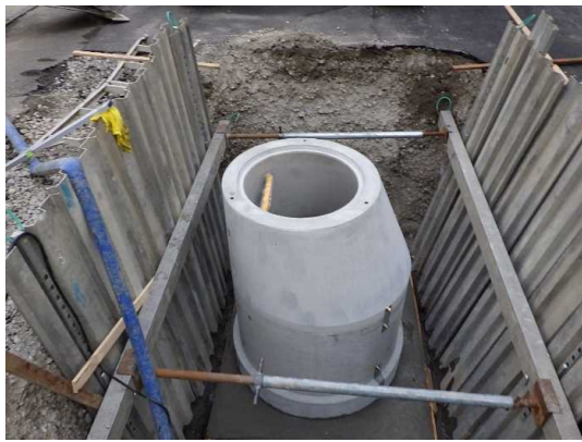
マンホール設置状況