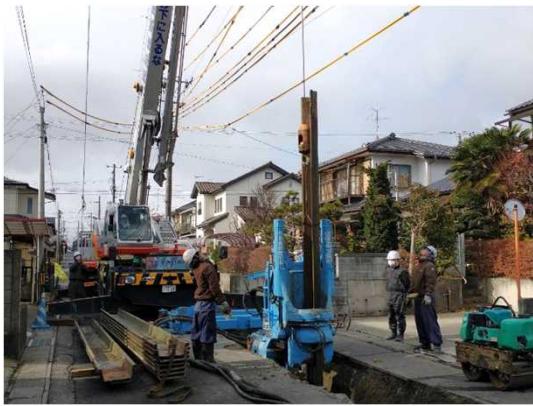
仮設土留(鋼矢板)撤去状況