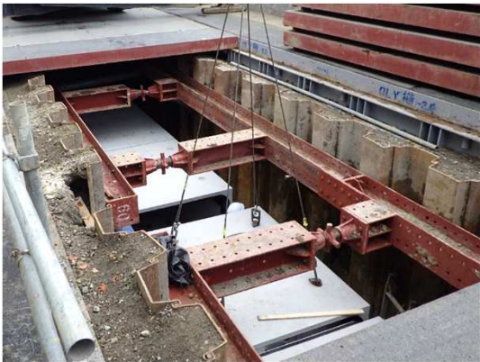
ボックスカルバート布設状況