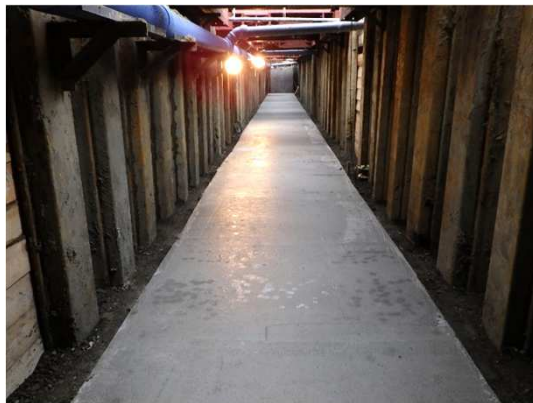
基礎工(コンクリート)完了状況