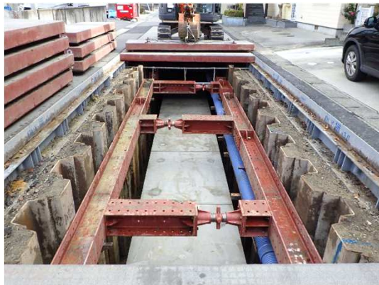
ボックスカルバート布設完了状況