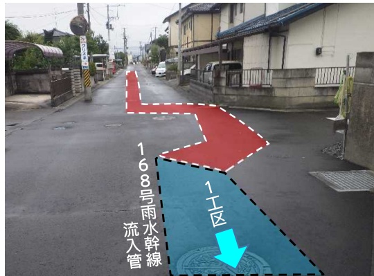
舗装仮復旧状況(下流側から上流側へ)

7月は、道路の後片付け等を行い、第2工区の工事が完了しました。 なお、引き続き第3工区に着手し、168号雨水幹線流入管の早期完成を目指します。