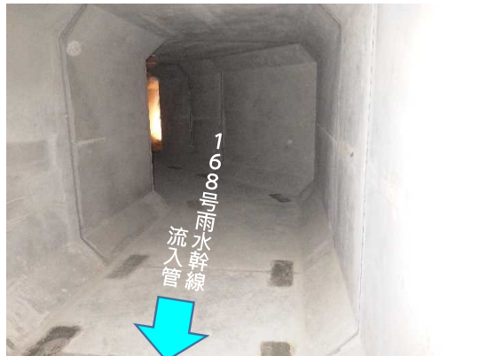
ホックスカバート(内部)状況(5月末時点)