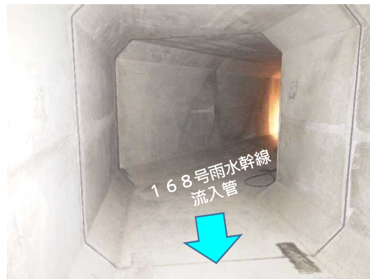
ホックスカバート(内部)状況(5月末時点)