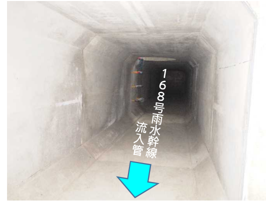
ホックスカバート(内部)状況(5月末時点)