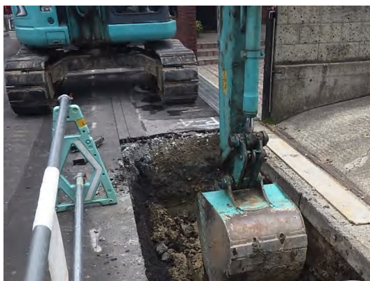
掘削(仮設土留工)状況

6月は、ボックスカルバート布設のための仮設土留に着手しました。 7月は、引き続き仮設土留を行い、覆工板設置に着手します。