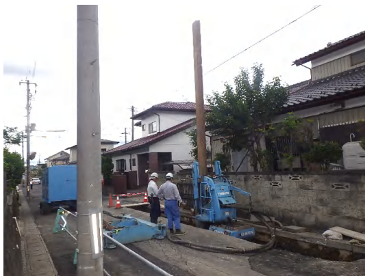
仮設土留(鋼矢板)施工状況