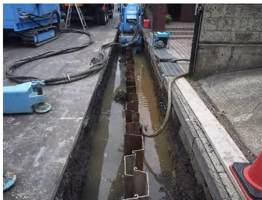
仮設土留(鋼矢板)施工状況