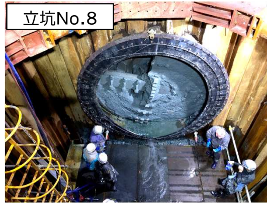
シールド掘進機の到達状況