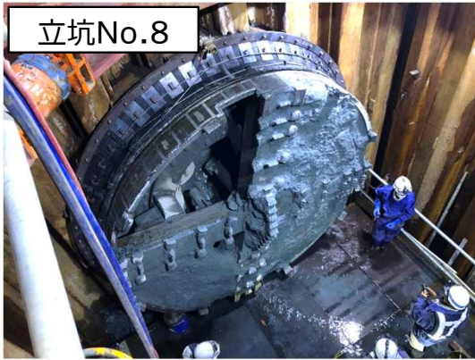
シールド掘進機の到達状況