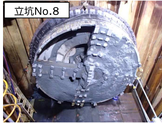
シールド掘進機の到達状況