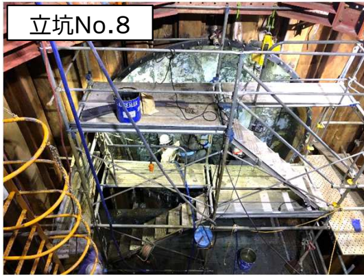
シールド掘進機の到達状況