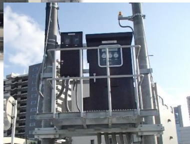
排水ポンプ制御盤設置状況