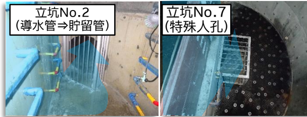
立坑No.2 (導水管⇒貯留管)