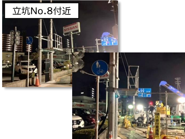
排水ポンプ制御盤設置に係る架台設置状況