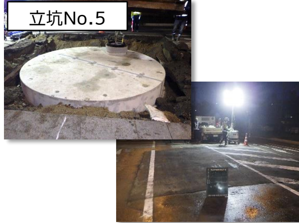
特殊(分水)人孔築造(蓋掛け)完了状況