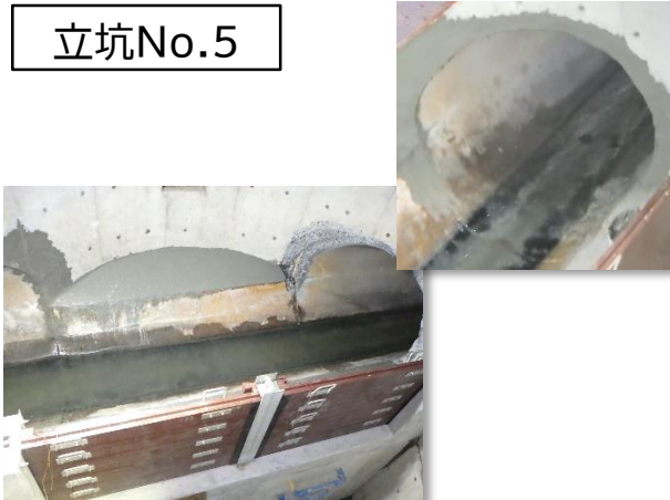
特殊(分水)人孔築造完了状況