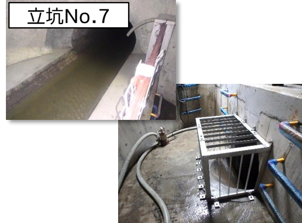
特殊(分水)人孔築造完了状況