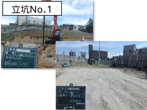
仮設土留撤去及び埋戻し状況

8月は、立坑No.1～No.8までのすべての特殊人孔築造が完了し、分水人孔から貯留管への雨水流入が可能な状態になりました。また、特殊人孔築造に係る仮設土留及び覆工板の撤去も完了しました。9月は、立坑No.8特殊人孔への排水ポンプ(2基)及び配管設置、制御盤設置等を行います。