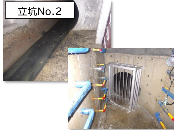
特殊(分水)人孔築造完了状況