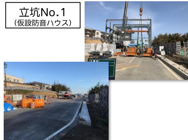
立坑No.1 (仮設防音ハウス)