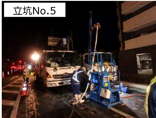
地盤改良(薬液注入)状況