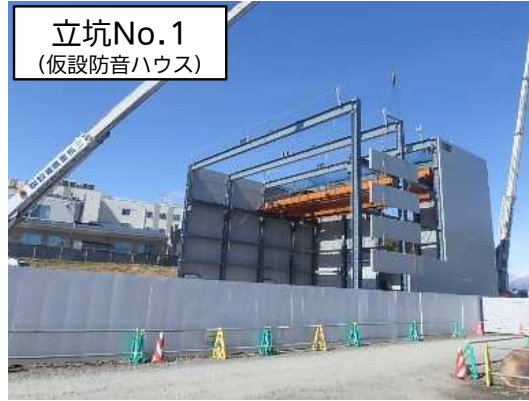
仮設防音ハウス解体・撤去状況