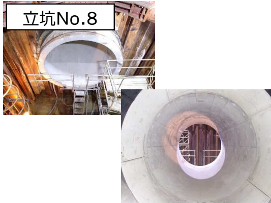
シールド掘進機外殻残置箇所仕上げ状況

3月は、引き続き、仮設防音ハウスの解体・撤去等を行い、立坑No.5及びNo.7の仮設土留設置に着手します。