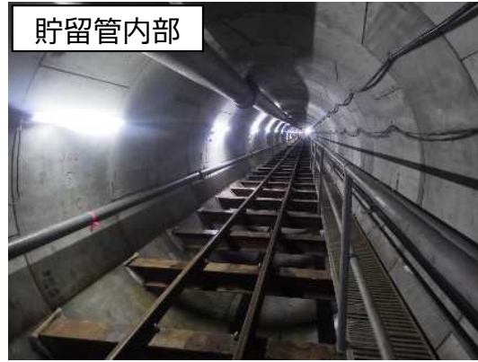
シールド掘進機による掘進状況(セグメント※設置完了)