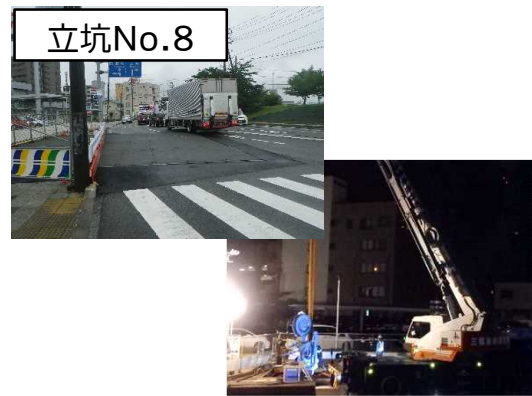
覆工板設置及び仮設鋼矢板設置状況