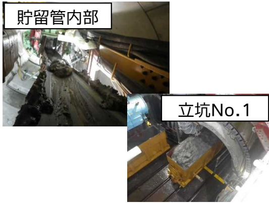
シールド掘進機による掘進状況(汚泥搬出)

7月は、シールド掘進機※による本掘進に向けた段取替え作業が完了し、本掘進に着手(約297m完了)し、到達立坑No.8の覆工板設置及び仮設土留(鋼矢板)設置を行い、立坑No.2の地盤改良(薬液注入)に着手しました。8月は、引き続き、シールド掘進機による本掘進及び立坑No.2の地盤改良、立坑No.8の鋼矢板設置を行います。