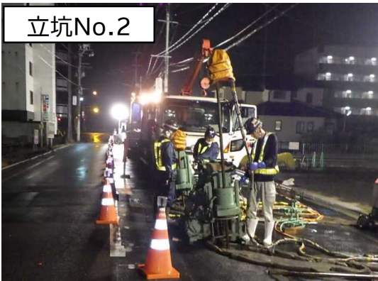
地盤改良(薬液注入)状況