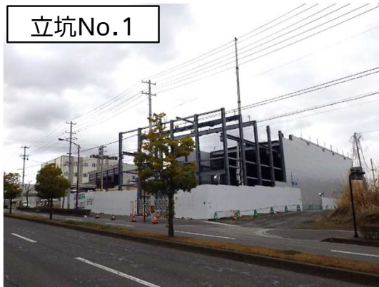
仮設防音ハウス組立状況