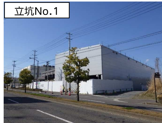
仮設防音ハウス組立完了状況