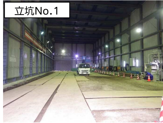
仮設防音ハウス組立完了状況