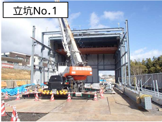
仮設防音ハウス組立状況

3月は、仮設防音ハウス組立及びシールド掘進機に係る設備の設置等を行いました。 4月は、立坑No.1内のシールド掘進機の試運転等を行います。