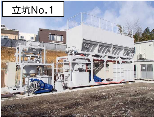
掘進用設備(裏込注入装置)設置状況

2月は、シールド掘進機に係る設備の搬入・設置等を行い、掘進機の搬入・組立が完了しました。また、仮設防音ハウス組立等に着手しました。 3月は、引き続き、仮設防音ハウス組立を行います。