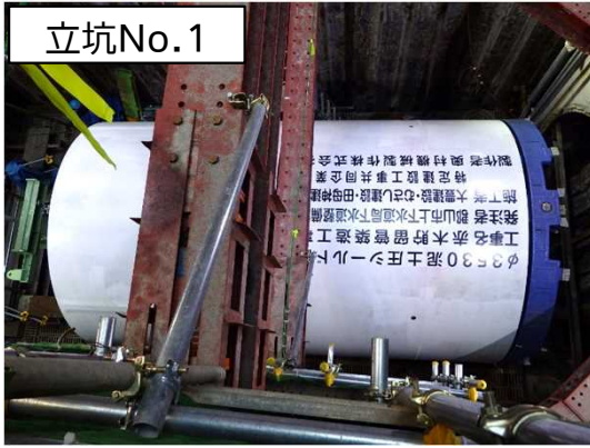
シールド掘進機組立状況