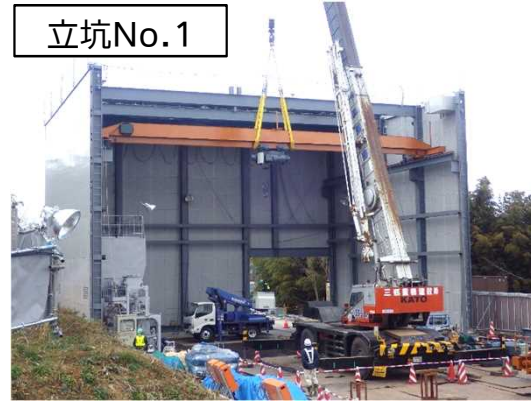
仮設防音ハウス組立状況