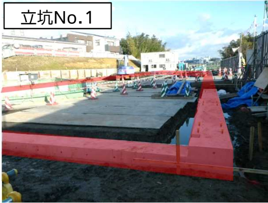
仮設防音ハウス基礎工状況