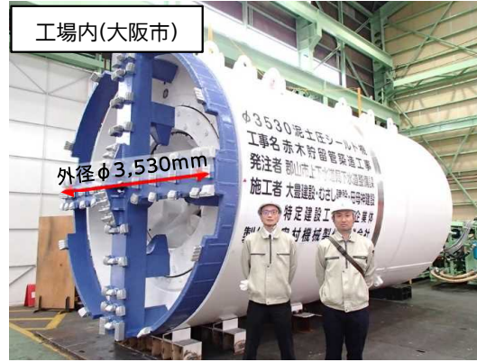
シールド掘進機仮組完了状況(工場検査)