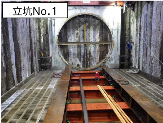
坑口工及び発進架台設置状況