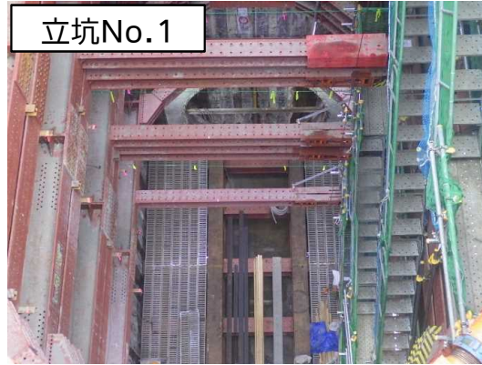
坑口工及び発進架台設置状況