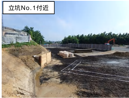
造成及び仮囲い設置状況