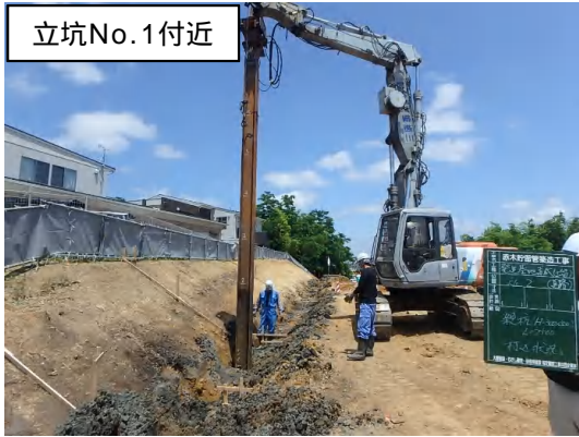
造成(仮設土留)状況

7月は、シールド工事の発進立坑No.1の掘削のための造成及び仮囲い設置等を行いました。 8月は、立坑No.1の土留(柱列式連続地中壁)に着手します。