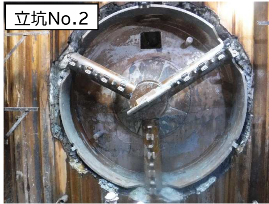
シールド掘進機の到達状況