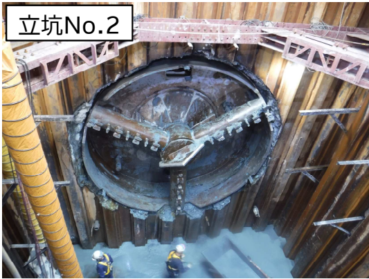
シールド掘進機の到達状況