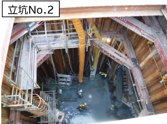
シールド掘進機の到達(準備)状況