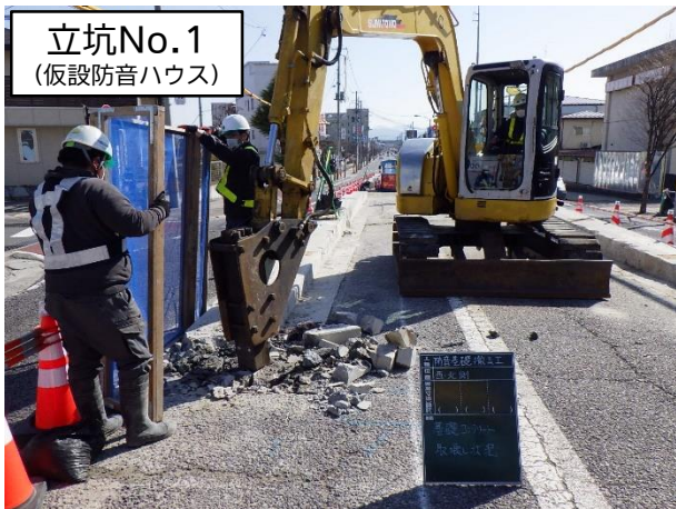
仮設防音ハウス基礎撤去状況