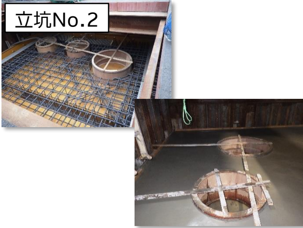
特殊人孔築造(配筋・コンクリート打設)状況