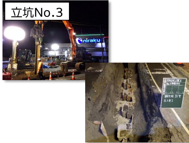
仮設土留設置状況