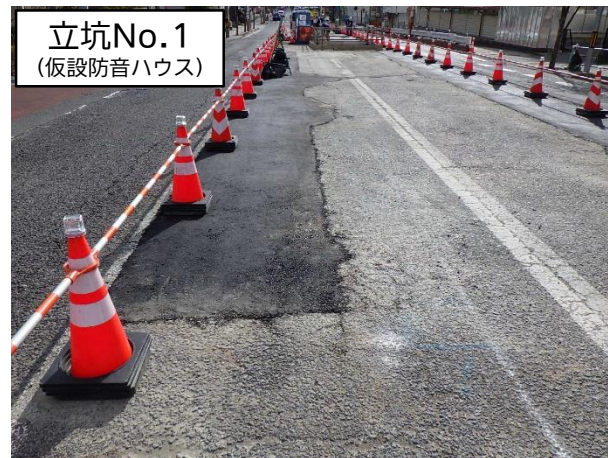
仮設防音ハウス基礎撤去完了状況