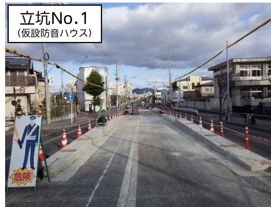
立坑No.1 (仮設防音ハウス)