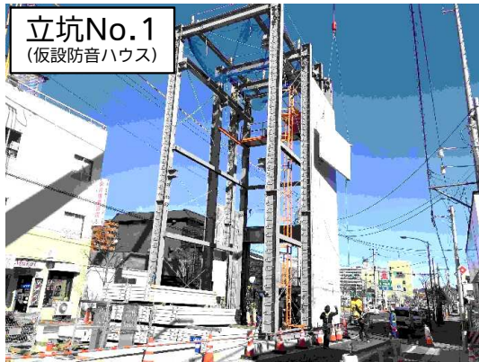
立坑No.1 (仮設防音ハウス)