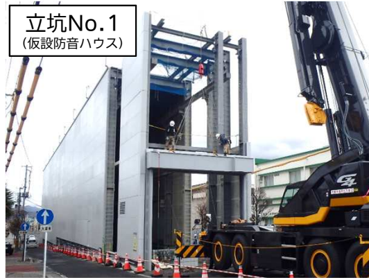
仮設防音ハウス解体・撤去状況