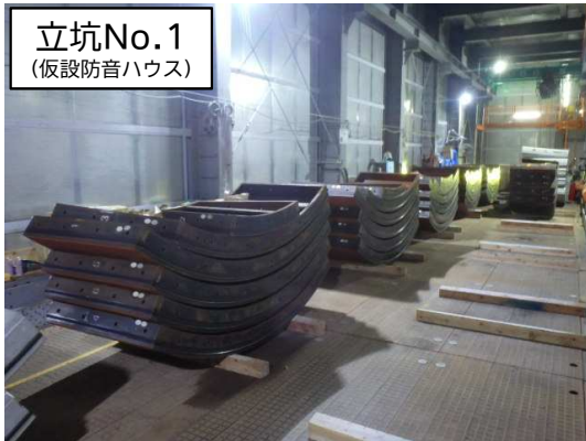
立坑No.1 (仮設防音ハウス)

9月は、シールド掘進機※による本掘進(約443m完了)を行いました。 10月は、引き続き、シールド掘進機による本掘進を行い、立坑No.2まで到達する予定です。