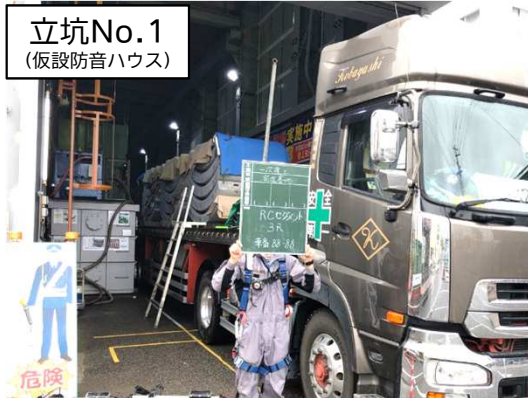
立坑No.1 (仮設防音ハウス)

8月は、シールド掘進機※による本掘進(約273m完了)を行いました。 9月は、引き続き、シールド掘進機による本掘進を行います。