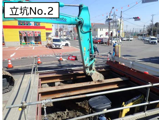
掘削・仮設土留支保状況