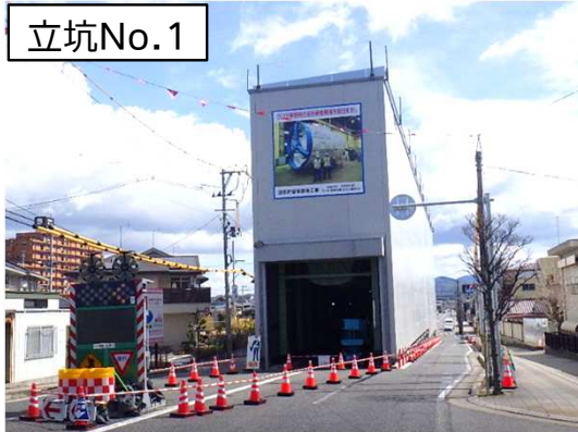
仮設防音ハウス設置状況(東側を望む)