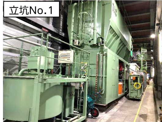
仮設防音ハウス内設備等設置状況(1階)