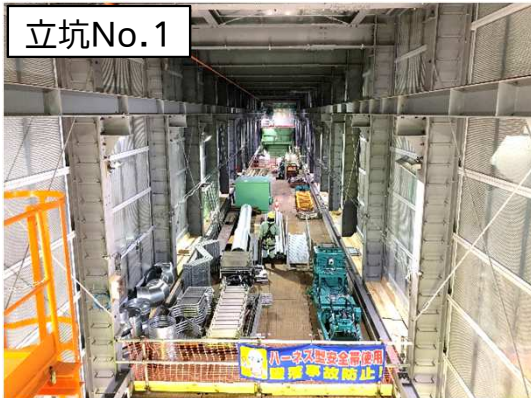
仮設防音ハウス内設備等設置状況(2階)