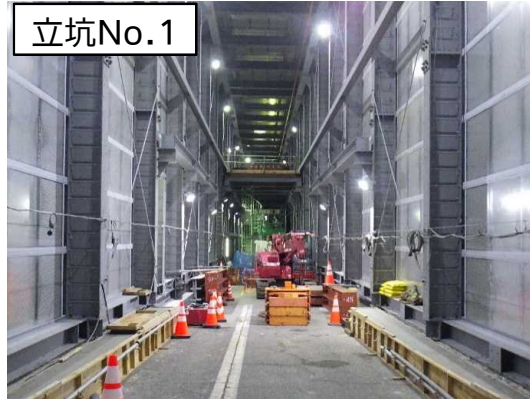
仮設防音ハウス内設備設置状況(1階)