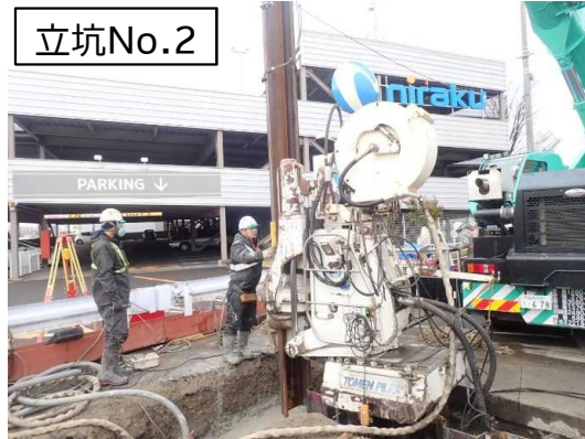
仮設土留設置状況