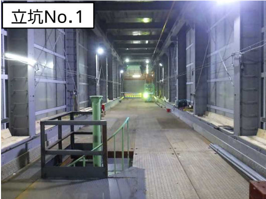
仮設防音ハウス内設備等設置状況(2階)