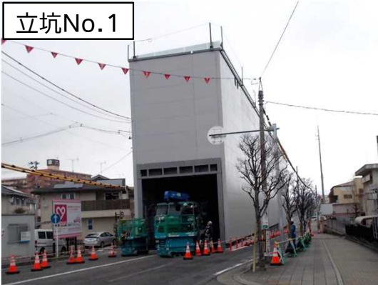
仮設防音ハウス組立状況(東側を望む)