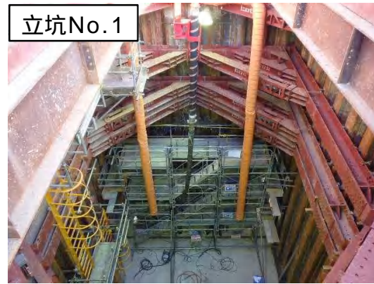
坑口施工(コンクリート打設)状況