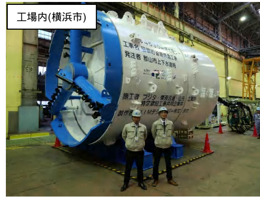
工場内(横浜市) シールド掘進機仮組完了状況(工場検査)