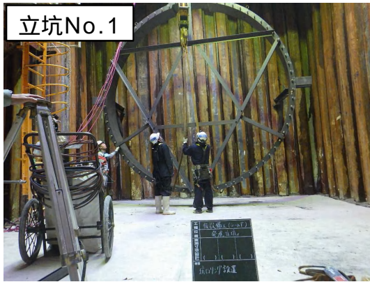
坑口施工(リング搬入・設置)状況

11月は、立坑No.1からシールド工事用掘進機を発進するための坑口工を行いました。 12月は、立坑No.1内で掘進機組立に係る設備の搬入・設置を行い、掘進機を分割して搬入し、立坑内で組立等に着手します。