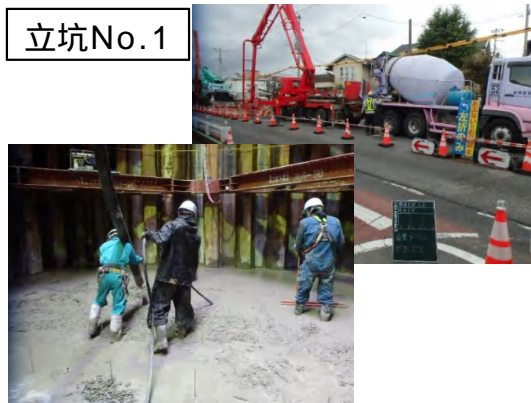
底盤コンクリート打設状況