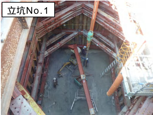
掘削・支保工状況

10月は、シールド工事の発進立坑No.1の掘削・支保工及び底盤コンクリート打設等を行いました。 11月は、立坑No.1へ掘進機 組立に係る設備の搬入・設置を行います。