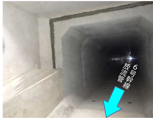
ボックスカバー布設完了状況(内部)