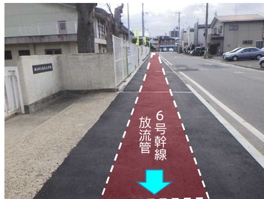
舗装仮復旧状況(赤木小学校正門前付近)