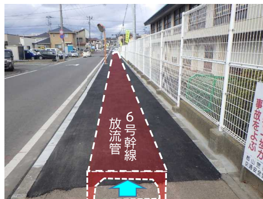
舗装仮復旧状況(上流側から下流側へ)