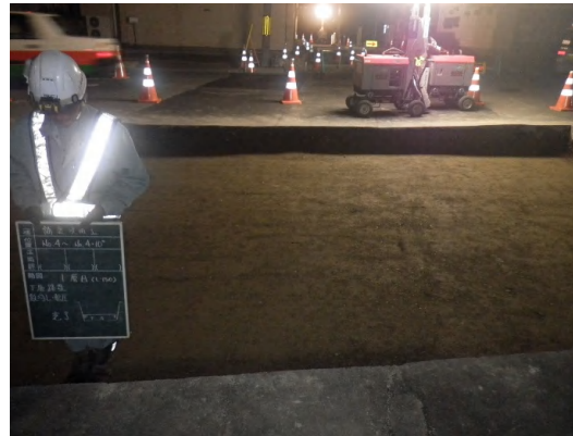
下層路盤(転圧)完了状況