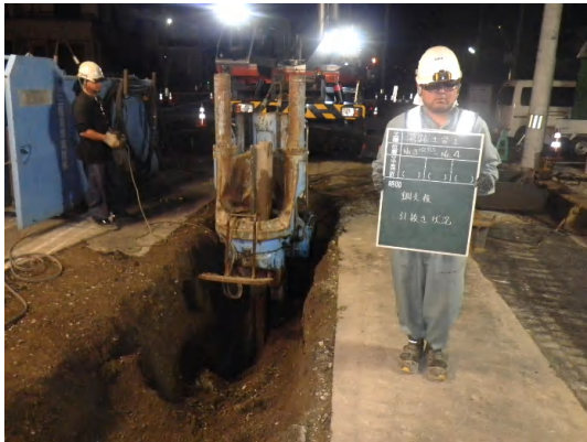
仮設土留撤去(鋼矢板引抜き)状況

9月は、覆工板及び仮設土留撤去、埋戻し、道路附属物の復旧を完了し、舗装の仮復旧を行いました。 10月は、舗装の本復旧を行い、第2工区のすべての工事が完了する予定です。