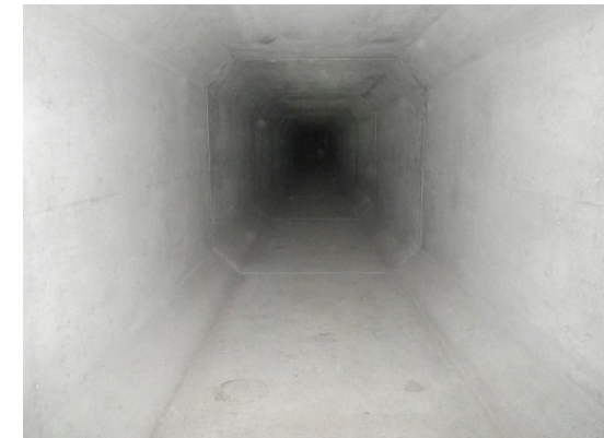
ボックスカバート布設完了(内部)状況(8月末)