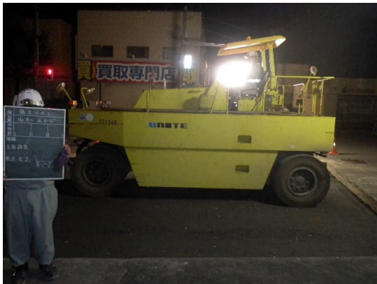
上層路盤(転圧)状況