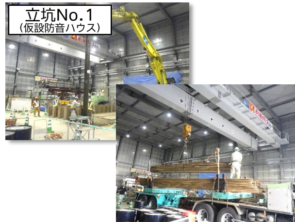
シールド工に係る各種設備撤去・搬出状況