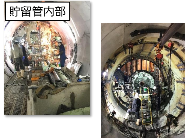
シールド掘進機の解体・撤去状況