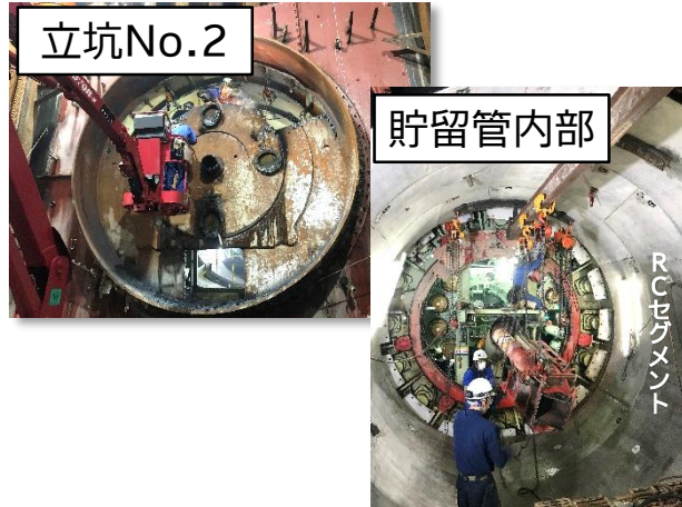
シールド掘進機の解体・撤去状況

10月は、シールド掘進機の解体・撤去及びシールド工に係る各種設備の撤去等を行いました。 11月は、引き続き、シールド工に係る各種設備の撤去等を行います。