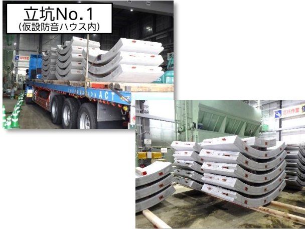
セグメント搬入・保管状況

3月は、シールド掘進機※による初期掘進(セグメント※設置)(施工延長約74m完了)を行いました。 4月は、引き続き、シールド掘進機による初期掘進を行い、本掘進に向けた段取り替えを行います。