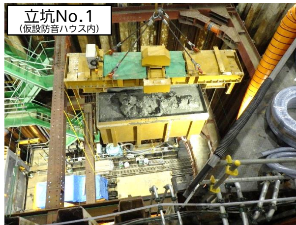
シールド掘進機による掘進(汚泥搬出)状況