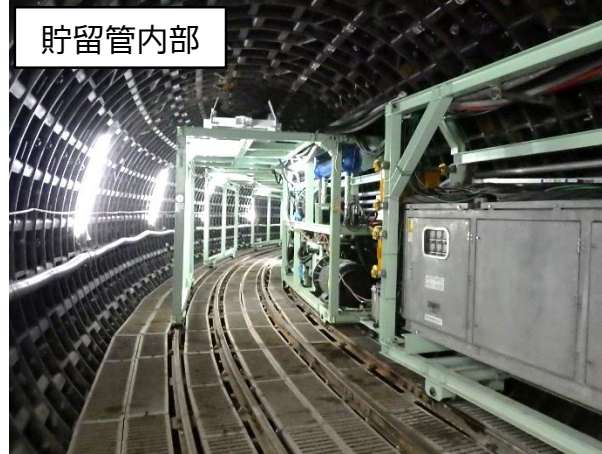
シールド掘進機による掘進状況