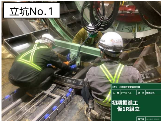
シールド掘進機※による掘進(仮セグメント設置)状況