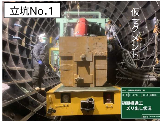
シールド掘進機による掘進(汚泥搬出)状況