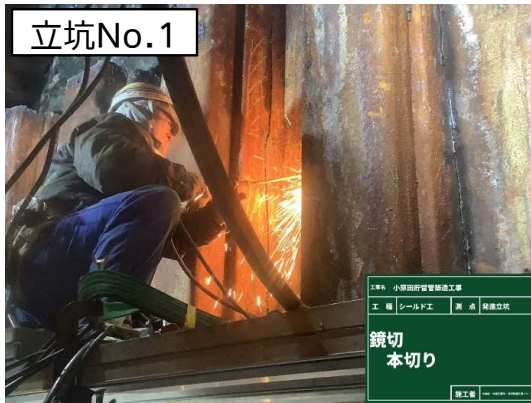
鏡切(鋼矢板切断)状況

2月は、鏡切(掘進機挿入部鋼矢板壁撤去)を行い、シールド工事の初期掘進(セグメント※設置)を開始しました。 3月は、引き続き、シールド工事の初期掘進(セグメント設置)を行います。