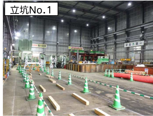
立坑No.1 各種設備設置状況(仮設防音ハウス内)