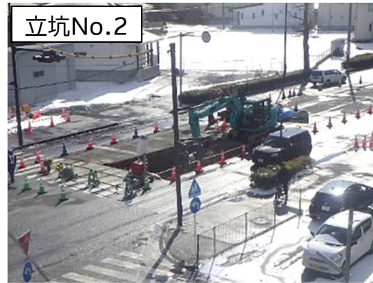
立坑No.2 掘削・土留状況(全景)