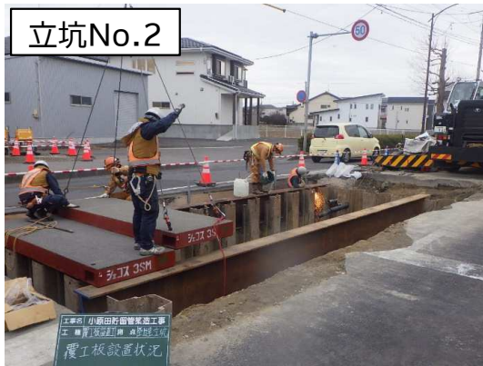
立坑No.2 覆工板設置状況