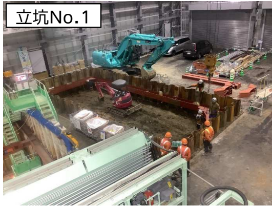
立坑No.1 土砂ピット設置状況(仮設防音ハウス内)

1月は、シールド掘進機※に係る仮設備の設置等を行い、立坑No.2の仮設土留及び覆工板設置等を行いました。 2月は、鏡切(掘進機挿入部鋼矢板壁撤去)を行い、シールド工事の掘進(セグメント※設置)を開始します。