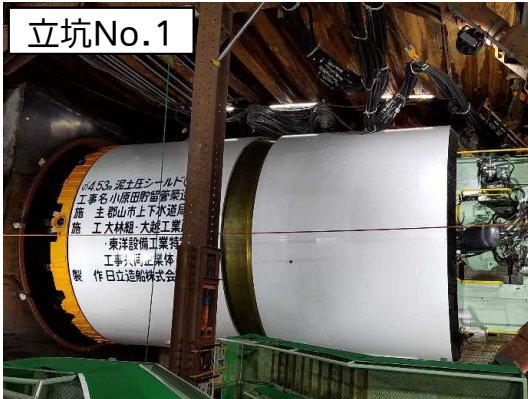
シールド掘進機組立(完了)状況(池田公園内)

12月は、仮設防音ハウス(立坑No.1)内のシールド掘進機に係る設備の搬入・設置等を行い、掘進機の組立及び調整・試運転が完了しました。また、立坑No.2の仮設土留設置等を行いました。 1月は、シールド掘進機に係る仮設備の設置等を行います。