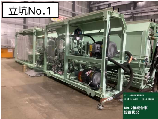
各種設備設置状況(仮設防音ハウス内)