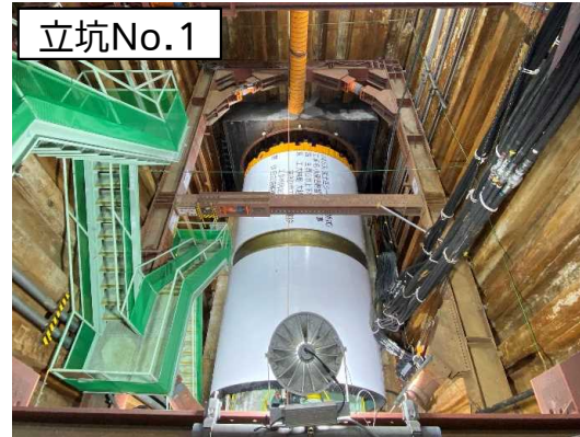
シールド掘進機組立(完了)状況(池田公園内)