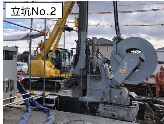
仮設土留(鋼矢板)設置状況