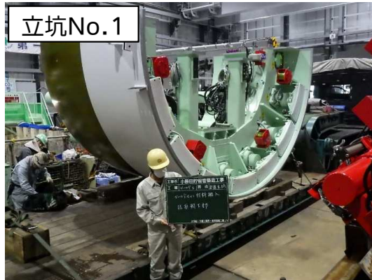
シールド掘進機搬入状況