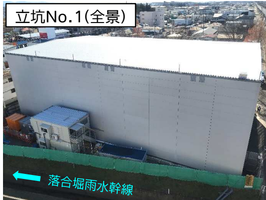
仮設防音ハウス組立完了状況(池田公園内)

11月は、立坑No.1の仮設防音ハウス組立が完了し、シールド掘進機*の組立等に着手しました。 12月は、引き続き、シールド掘進機組立及び立坑No.2の仮設土留設置等を行います。