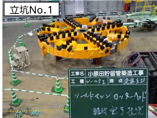
シールド掘進機(カッターヘッド)組立状況(池田公園内)