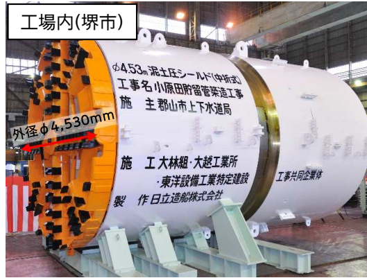
シールド掘進機仮組完了状況(工場検査)