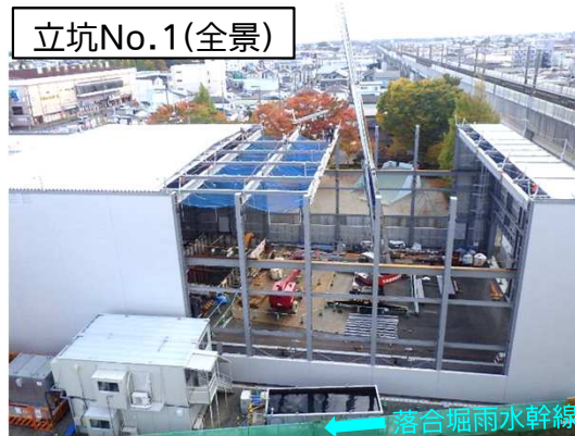
仮設防音ハウス組立状況(池田公園内)