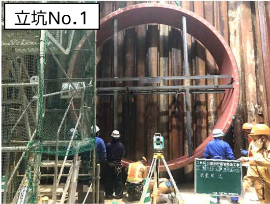
坑口施工(リング搬入・設置)状況