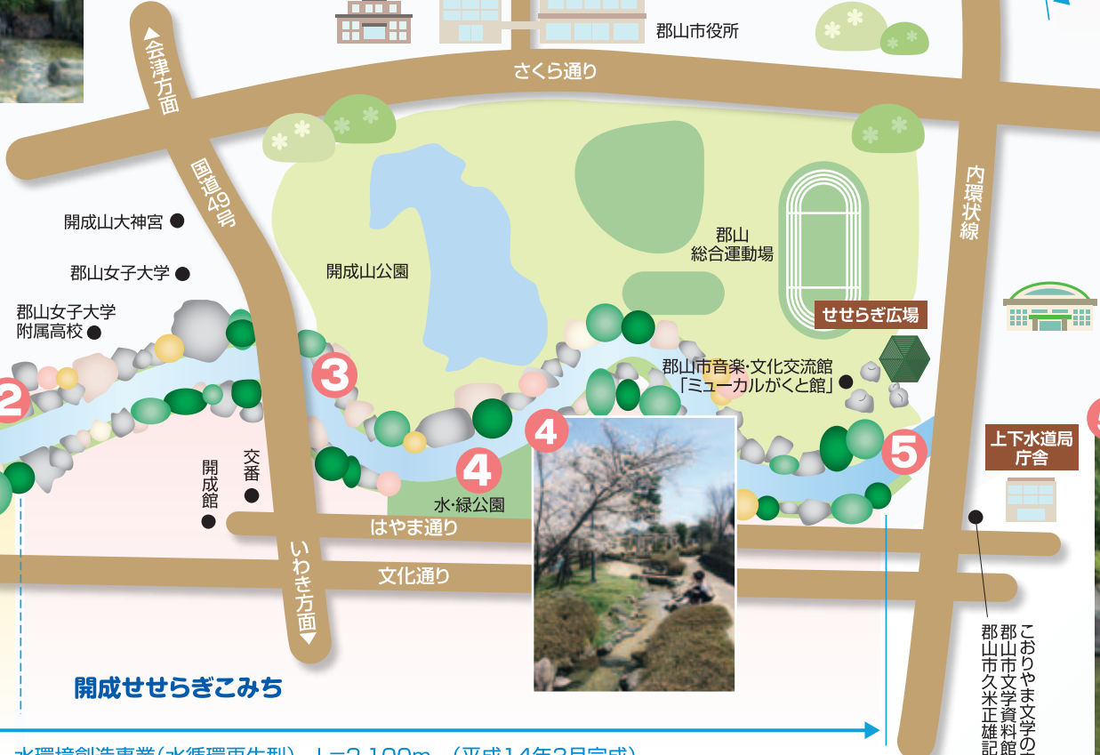
台新せせらぎこみち