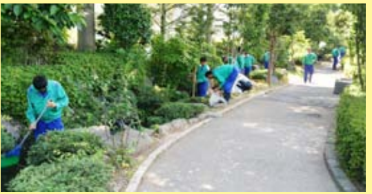
第一期 水循環・再生下水道モデル事業 L=1,000m (平成10年3月完成)

清掃に必要なデッキブラシやごみ袋等の貸し出しも行って おります。ボランティア活動へ御協力いただける方がお りましたら、是非、下水道保全課までお問い合わせください。