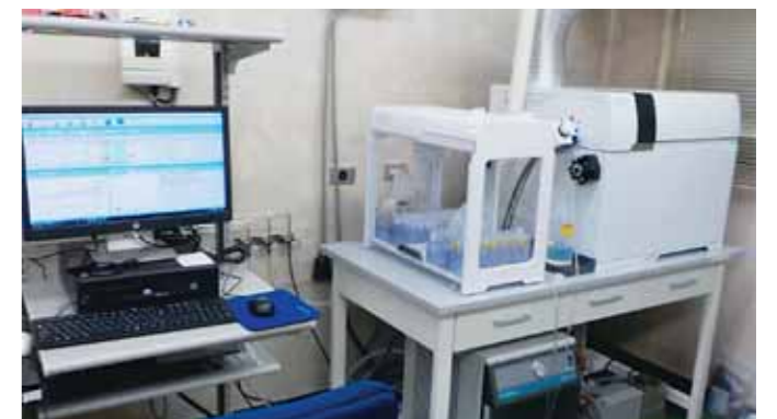
水質管理室の検査機器