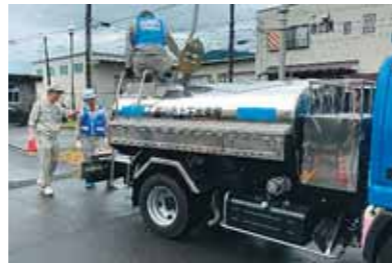
給水基地での給水車への充水作業

今後も、県内及び隣県の水道事業体との合同訓練に参加するなど、地震等の災害発生に備え、災害対策に万全を期してまいります。