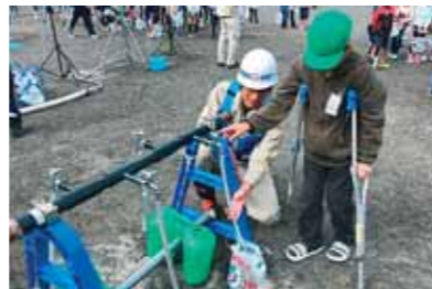
静岡市立長田南小学校での応急給水活動