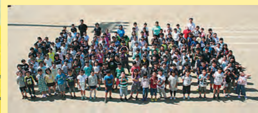
富田東小学校4年生の皆さん