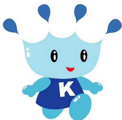
郡山市水道キャラクター きららん