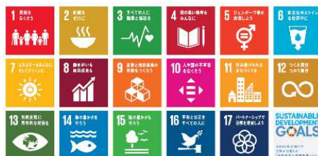
▲17の目標を示した世界共通のロゴマーク