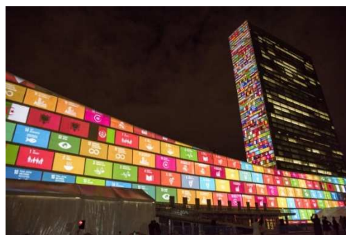
国連本部にSDGsに関する映像が投影されたときの様子(2015年)