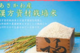
あさかわ漢方資材栽培米

化学肥料や農薬の代わりに漢方資材を利用して栽培した浅川町産のお米で、豊かな自然環境で生産され、食味に優れていると評判です。平成27年度東北ブロック環境保全型農業推進コンクールにおいて、東北農政局長賞を受賞しました。