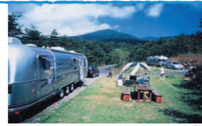
オートキャンプ場

森林(もり)との共生をコンセプトにした国内トップクラスの規模を誇るオートキャンプ場。コテージや常設トレイラーサイトもあり、もりのガイドやクラフトなど様々なプログラムに参加すると、今まで経験したことのない森林の楽しみや恵みに気づくことができます。