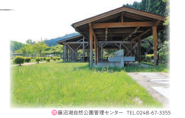
須賀川市基本データ 人口◎76,101人 世帯数◎27,130世帯

須賀川市 藤沼湖自然公園 豊かな自然を満喫できる公園です。公園内には、温泉施設やコテージ、パークゴルフ場のほか、キャンプやバーベキューが楽しめるフリーサイトやオートキャンプ場があります。 アクセス 須賀川市江花字石倉山2-2 東北自動車道須賀川ICから県道中野須賀川線国道118号線を「会津田島」方面へ車で約35分