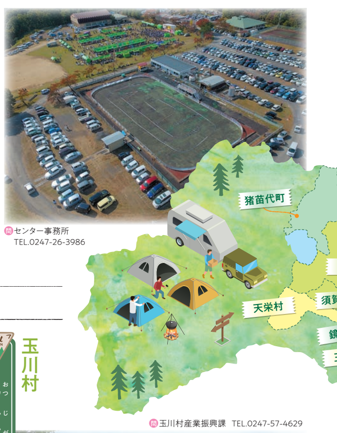
猪苗代町基本データ 人口◎14,178人 世帯数◎4,930世帯

浅川町 城山公園 山頂は公園として整備されており、安達太良山、那須連峰、八溝山系の美しい山並みが一望できます。車道、遊歩道が整備され、桜やツツジのほか四季折々の草花が楽しめます。 アクセス 浅川町大字 石川郡浅川町大字浅川字城山 JR水郡線 磐城浅川駅から車で5分、徒歩20分