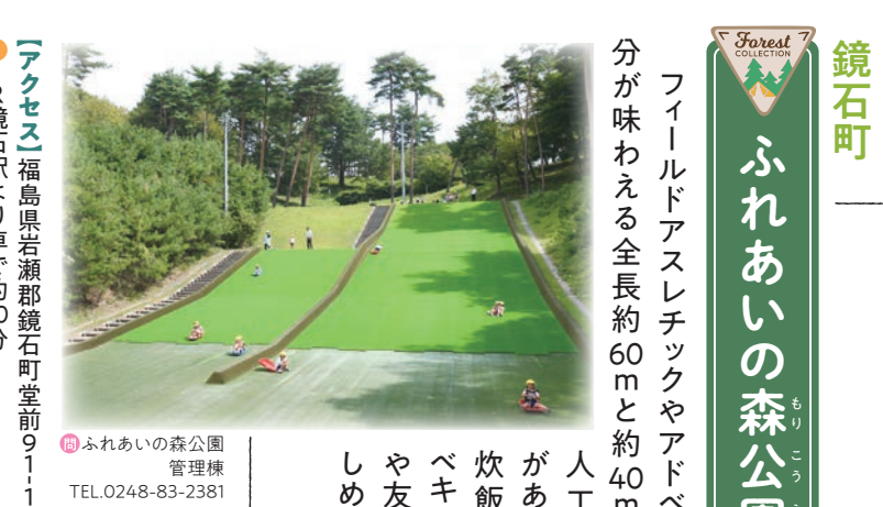
大玉村基本データ 人口◎8,758人 世帯数◎2,871世帯

大玉村 フォレストパーク あだたら 森林(もり)との共生をコンセプトにした国内トップクラスの規模を誇るオートキャンプ場。コテージや常設トレーラーサイト、温泉施設もあり、日帰りで利用も可能です。 アクセス 大玉村玉井字長久保6-8 東北自動車道本宮ICまたは二本松ICから車で30分