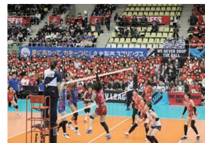
白熱する試合展開