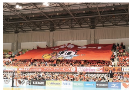
2019年2月に開催された初のホーム戦

さらにエアリービーズは、公式戦以外にも地域貢献活動として小学生を対象とした大会の開催や、中学生対象のバレーボール教室を引き続き開催する予定です。両市にとどまらず、広域圏の皆さんからエアリービーズに熱い声援を送ってください!!