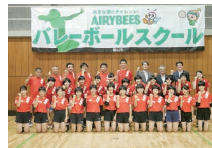
エアリービーズバレーボールスクール